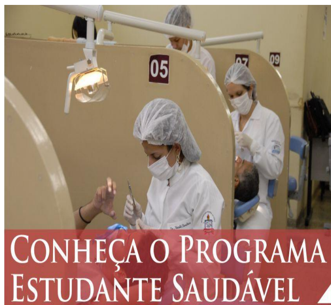
Figura 04 – Cartaz de divulgação do Programa Estudante Saudável/2011