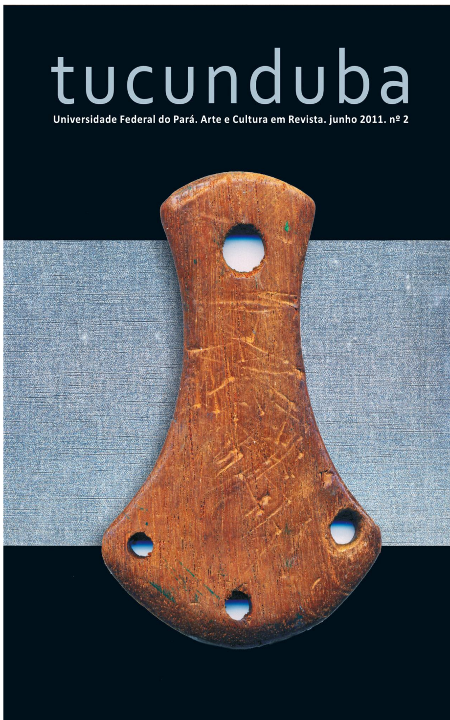
Figura 03 – Capa Revista tucunduba, junho/2011