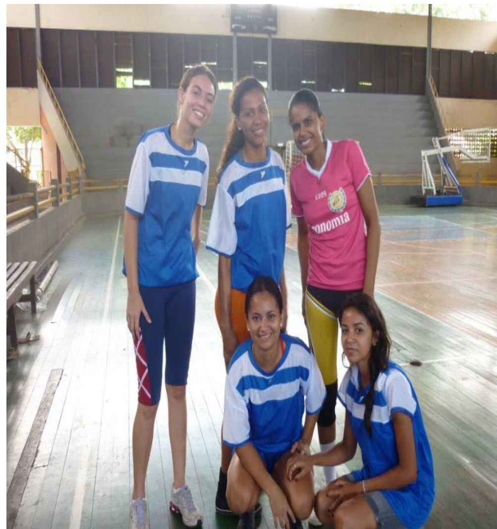
Foto 07 – Time feminino do Torneio de Futsal Universitário do Pará - CEUP