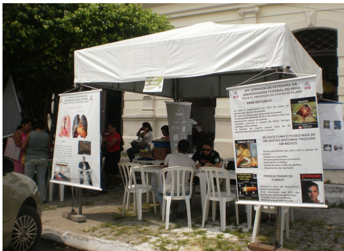
Foto 03 – XIV Jornada de Extensão Universitária – Serviços de saúde prestados à Comunidade