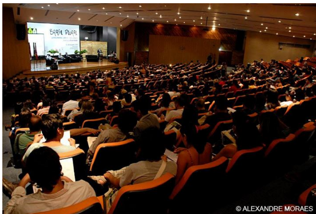
Foto 12 – Evento Acadêmico na UFPA – XXVII Reunião de Antropologia I/2011