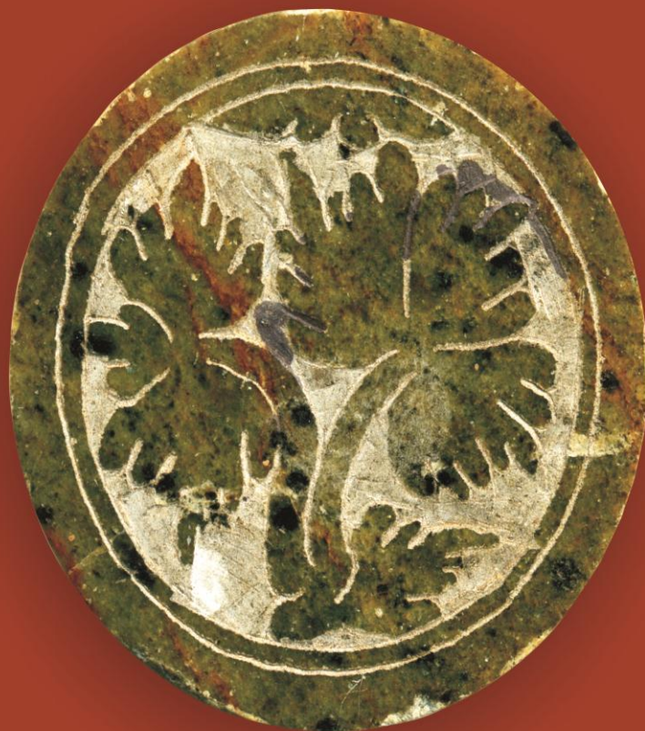
Figura 02 – Antologia - 2º Prêmio PROEX de Literatura/ 2011