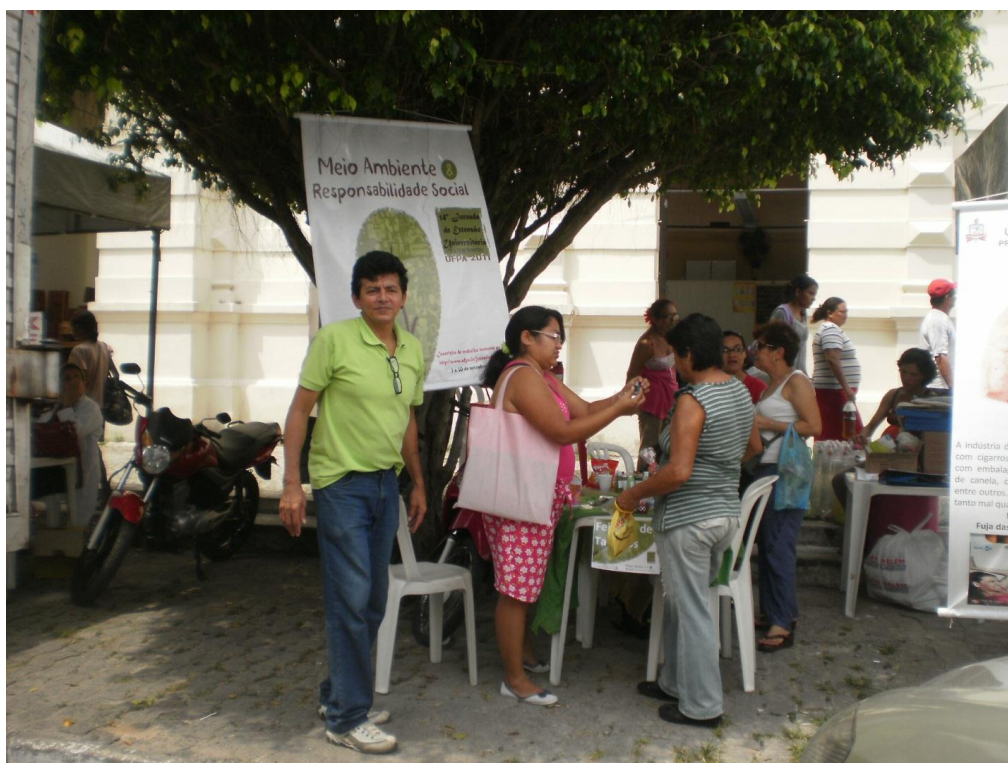
Foto 02 – XIV Jornada de Extensão Universitária – Meio Ambiente e Responsabilidade Social

As atividades da Jornada ocorrem mediante a apresentação de trabalhos, nas modalidades Comunicação Oral e Apresentação de Pôsteres, momento em que os discentes e docentes têm a oportunidade de apresentar suas produções acadêmicas e de serem submetidos à equipe de avaliadores (docentes e técnico-administrativos) que desenvolvem ações de extensão. Na Jornada, os discentes também podem inscrever seus trabalhos como autor ou coautor para concorrerem ao Prêmio Jovem Extensionistas, desde que em sua composição não tenha a participação de docente como autor ou coautor. Além da produção acadêmica, estudantes e professores, levam os resultados do conhecimento produzido até a comunidade em forma de prestação de serviços, pondo em prática o aprendizado adquirido.