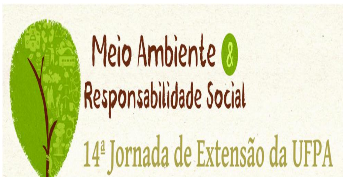
Figura 01 – Cartaz de divulgação da XIV Jornada de Extensão Universitária/2011