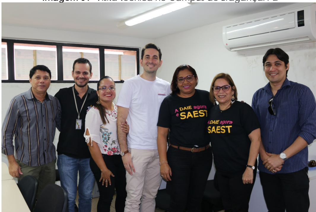
Imagem 01- Visita técnica no Campus de Bragança/PA