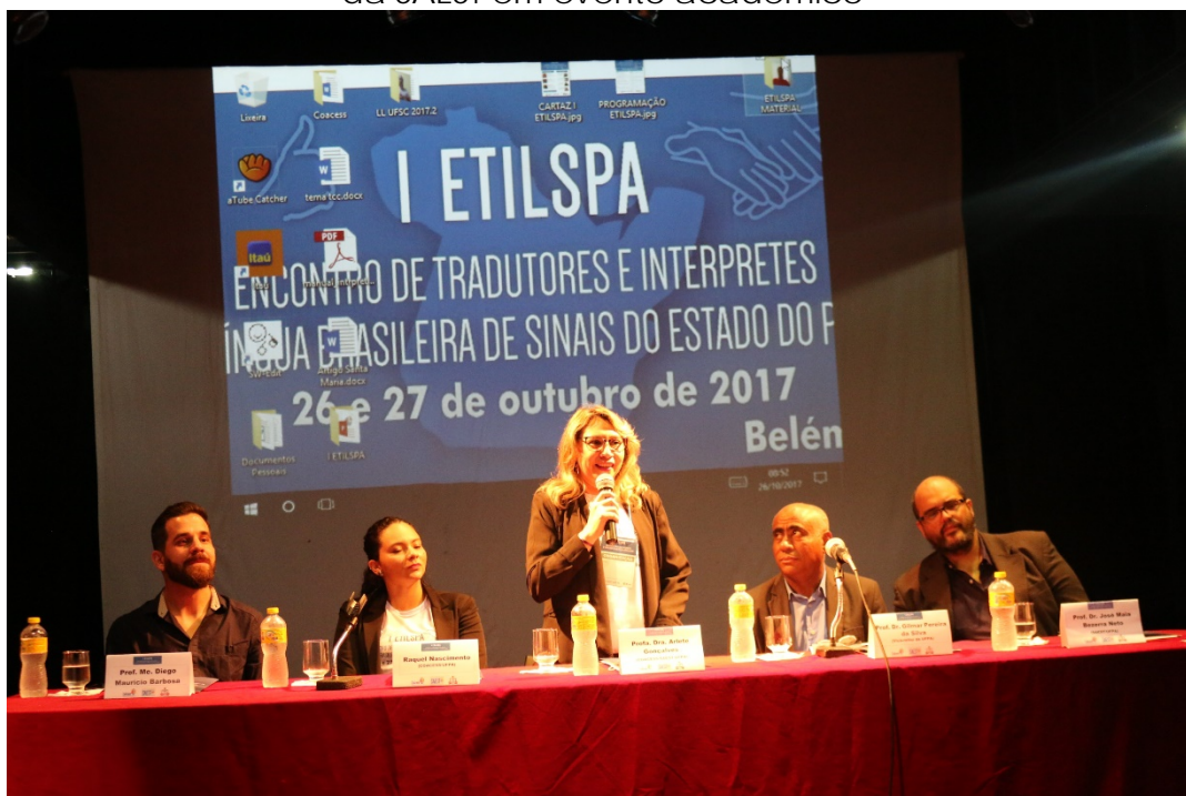
Imagem 02 - Participação do Superintendente e da Coordenadora de Acessibilidade da SAEST em evento acadêmico